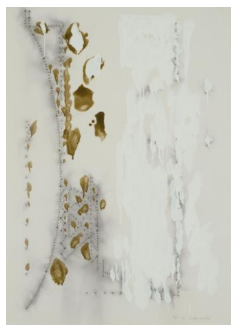
6 中西夏之《ドローイング》1981 ©NATSUYUKI NAKANISHI

お問い合わせ 東京都現代美術館 事業企画課 企画係 広報班 工藤・高橋 TEL : 03-5245-1134（直通） / FAX : 03-5245-1141 E-MAIL : mot-pr@mot-art.jp WEB : https://www.mot-art-museum.jp