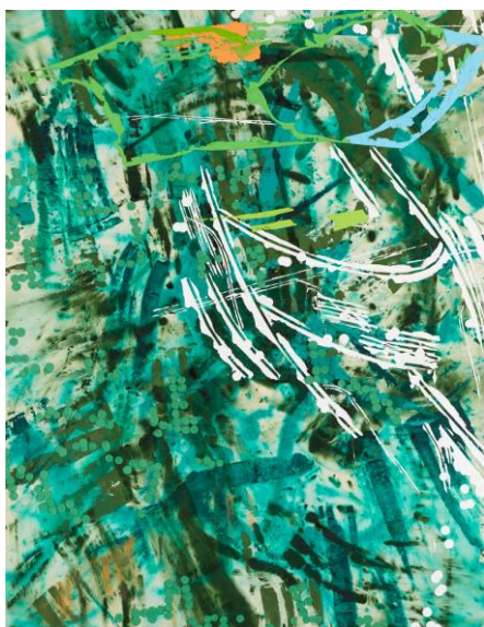
1 石川順恵《ゆるやかに開く窓から空 2001-1》2001 寄託（個人蔵）

広報用画像として本リリースに掲載している画像をご用意しております。 ご希望の際はキャプションについている番号を、広報までお知らせください。