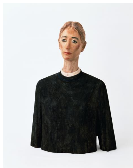
2 舟越桂《途切れないささやき》1990 寄託（個人蔵） Photo: Hiromu Narita © Katsura Funakoshi, Courtesy of Nishimura Gallery