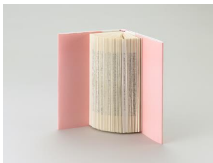
4 福田尚代《翼あるもの『ポータブル文学小史』》2013