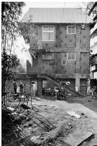
3 《吉阪自邸》1955年 (撮影：北田英治、1982年)