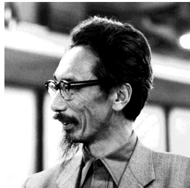
1 吉阪隆正

吉阪隆正は戦後復興期から1980年まで活躍した建築家です。「考現学」の創始者として知られる今和次郎や近代建築の巨匠ル・コルビュジエに師事し、人工土地*の上に住む住宅《吉阪自邸》、文部大臣芸術選奨(美術)を受賞した《ヴェネチア・ビエンナーレ日本館》、日本建築学会賞を受賞した《アテネ・フランセ》、東京都選定歴史的建造物に指定された《大学セミナー・ハウス 本館》などを手掛け、コンクリートによる彫塑的な造形を持った独特の建築で知られています。