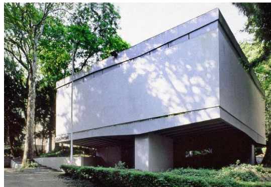
4 《ヴェネチア・ビエンナーレ日本館》1956年

お問い合わせ：東京都現代美術館 事業企画課 企画係 広報班 工藤・高橋 TEL：03-5245-1134(直通) / FAX：03-5245-1141 E-MAIL：mot-pr@mot-art.jp URL：https://www.mot-art-museum.jp