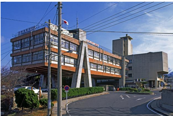
5 《江津市庁舎》1962年（撮影：北田英治、1994年）

吉阪の建築は、戦後の焼け跡に自らの住まいとして建てたバラック住宅から始まりました。以降、個人住宅や学校・市役所といった公共建築、極地での生活を考えた山岳建築、地域計画にまで発展。そのスケールを等身大から地球規模へ拡大していきました。これらの建築の仕事は一人で行っていたわけではありません。設計アトリエであるU研究室（63年に吉阪研究室から改称）を創設し、「不連続統一体（DISCONTINUOUS UNITY）」の考え方に集まった所員や、教鞭を執った大学院の学生らと共にディスカッションをしながら集団で建築を作り上げていきました。本展では30の建築とプロジェクトを紹介し、建築によって吉阪が目指したものとは何か、社会へのメッセージを紐解きます。その中でも地域計画のプロジェクト展示は初めてとなります。