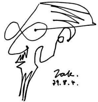
8 自画像《一筆描きのタカ》1979年 ©吉阪隆正

1917年東京生まれ。'33年ジュネーヴ・エコール・アンテルナショナル卒業。'41年早稲田大学建築学科卒業。今和次郎に師事し、農村や民家の調査に参加。「生活学」や「住居学」の研究を行う。'50年に戦後第1回フランス政府給付留学生として渡仏し、ル・コルビュジエのアトリエに2年間勤務。設計実務に携わり、ドミノシステムの実践やモデュロールの理論など、モダニズム建築の流儀を現場で学ぶ。'54年早稲田大学助教授、'59年に教授となる。'54年には設計アトリエである吉阪研究室（後にU研究室に改称）を設立し、本格的な建築設計を開始する。《吉阪自邸》（1955）、《浦邸》（1956）、《ヴェネチア・ビエンナーレ日本館》（1956）、《江津市庁舎》（1962）、《アテネ・フランセ》（1962）、《大学セミナー・ハウス》（1965-）などが代表作となる。世界各国の大学や会議に招聘されるなど国際的に活躍する一方、'70年には《21世紀の日本列島像》で内閣府総合賞を受賞するなど、新しい社会や環境、未来へ向けた集住とすがたを提言した。「住居学汎論」「ある住居」「生活とかたち—有形学」など多数の著作があり、師であるコルビュジエの著作も数多く翻訳、日本での普及に努めた。山岳建築や地域計画を手がけ、「人間—環境」の往還を強く意識し、環境や地形、気候に抗わない設計を行なうなど、ポストモダニズムを超越した建築思想に回帰した。'60年フランス学術文化勲章受章。日本建築学会会長、日本生活学会会長、日本山岳会理事、日本雪氷学会理事などを歴任。冒険家・アルピニストとしては'57年早稲田大学赤道アフリカ横断遠征隊を指揮し、キリマンジャロ登頂では女性隊員の登坂の歴史を開く。'60年早大アラスカ・マッキンレー遠征隊では隊長を務め、ヒマラヤK2遠征隊も組織した。