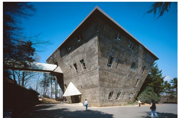
6 《大学セミナー・ハウス 本館》1965年（撮影：北田英治、1997年）