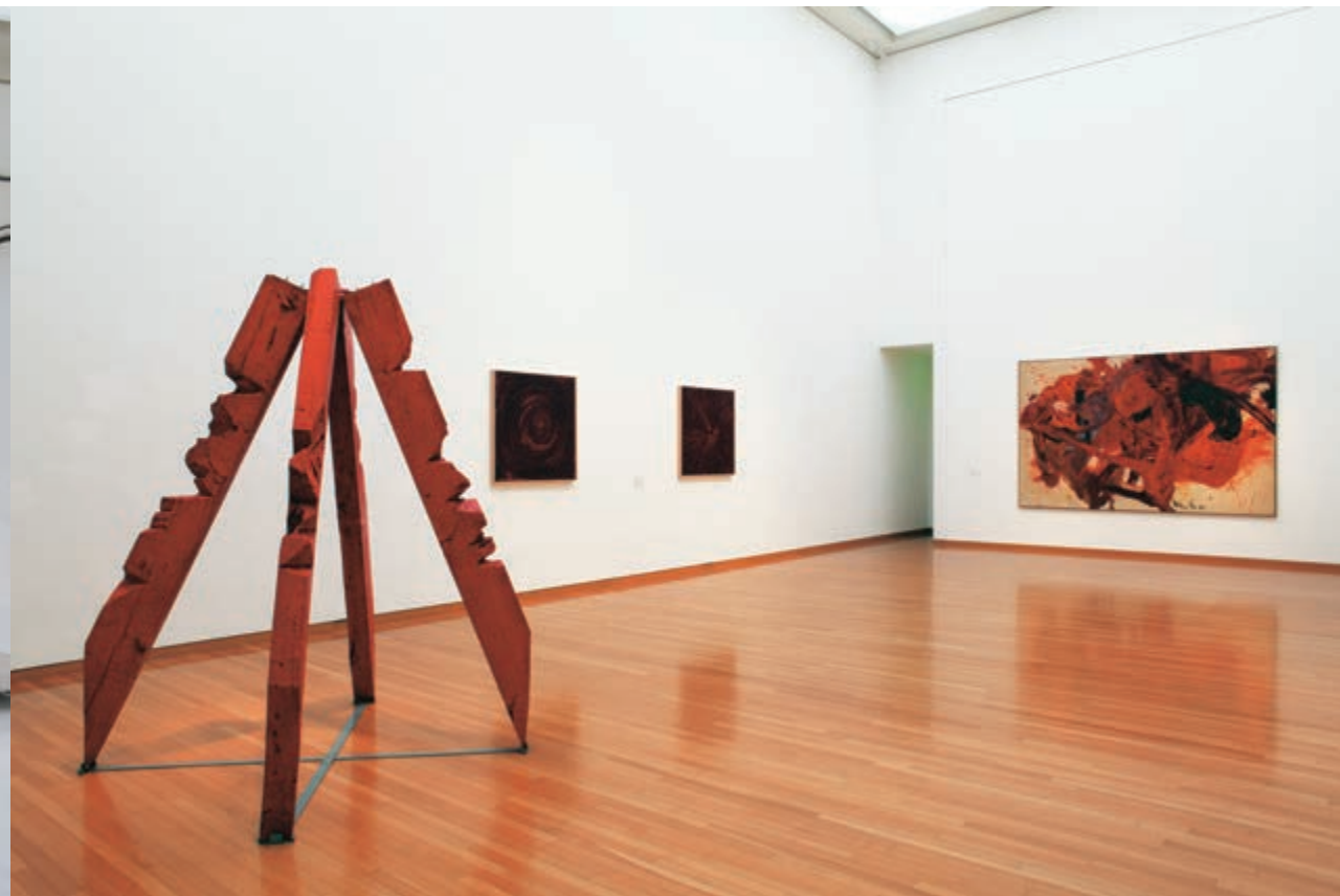
Installation view of "MOT collection", 2011–2012, Works of Kazuo Shiraga