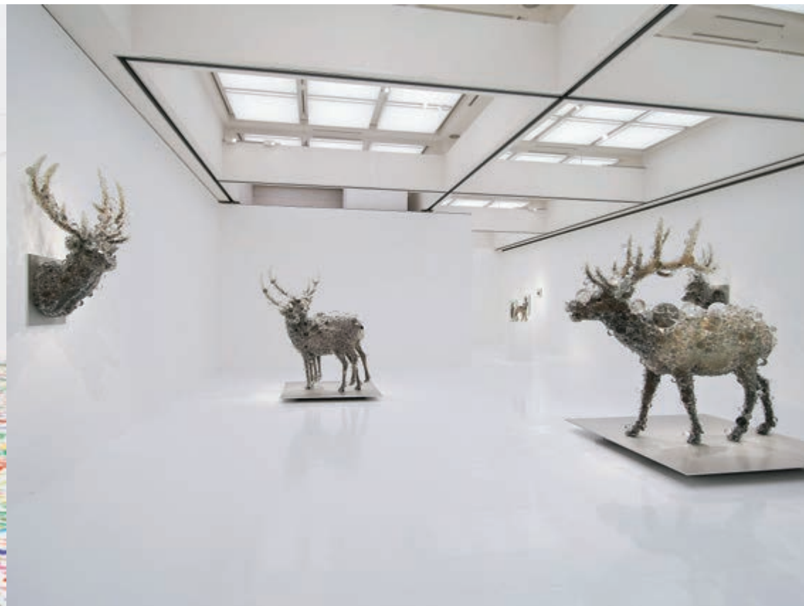
Installation view, "KOHEI NAWA - SYNTHESIS," 2011, Photo: Seiji TOYONAGA | SANDWICH, ©Kohei Nawa *(PixCell-Elk#2)2009, Work created with the support of Fondation d'entreprise Hermès