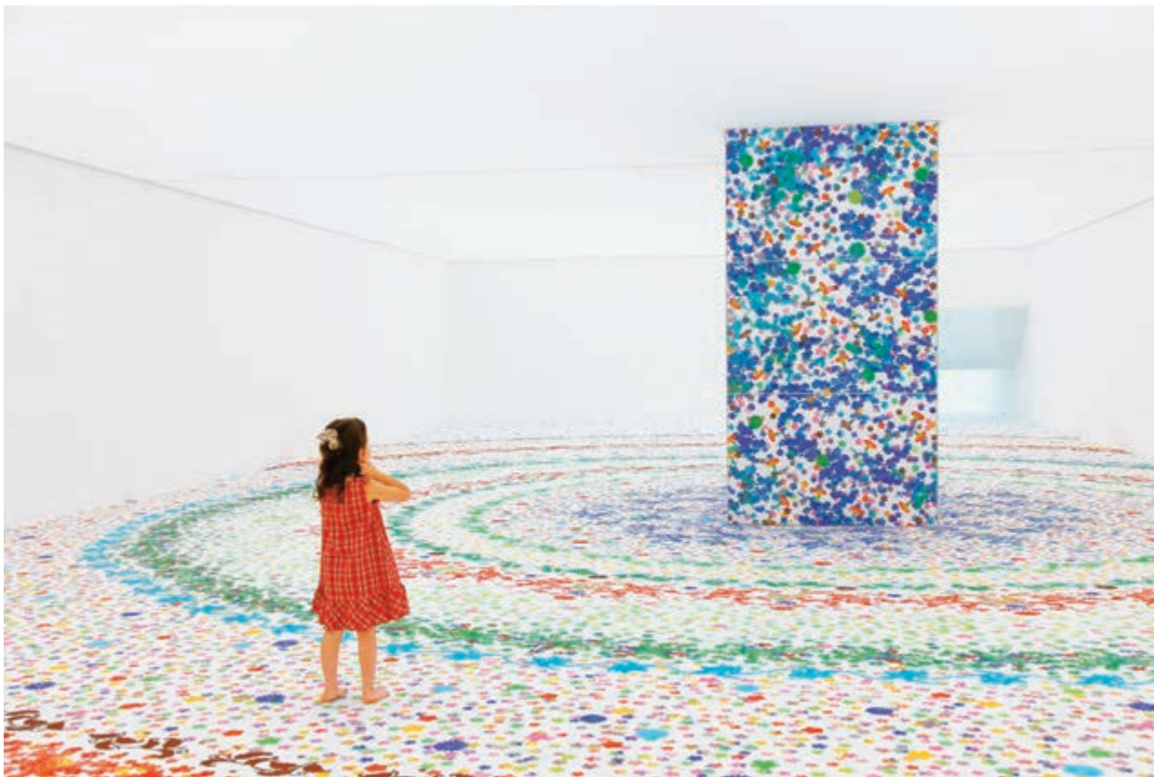
Installation view of "Garden for Children", 2010, Work of Shinji Ohmaki