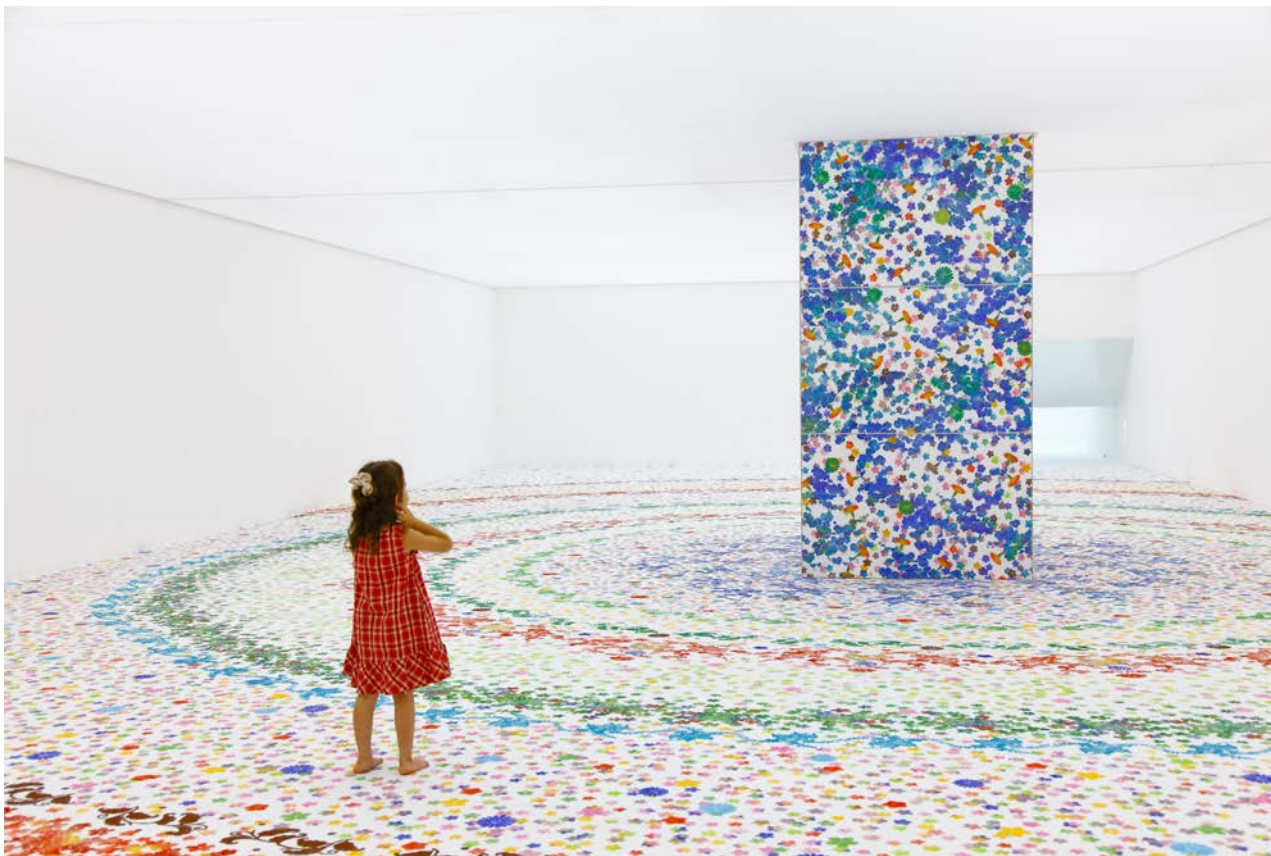
Installation view of "Garden for Children", 2010, Work of Shinji Ohmaki