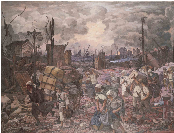
2. 鹿子木孟郎《大正12年9月1日》制作年不詳