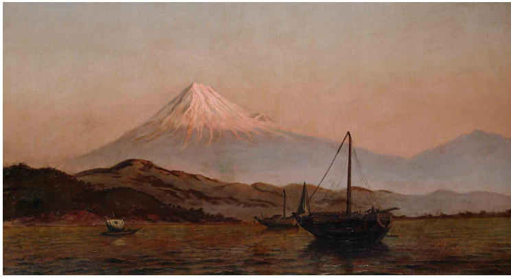
1. 五姓田義松《清水の富士》1880年頃