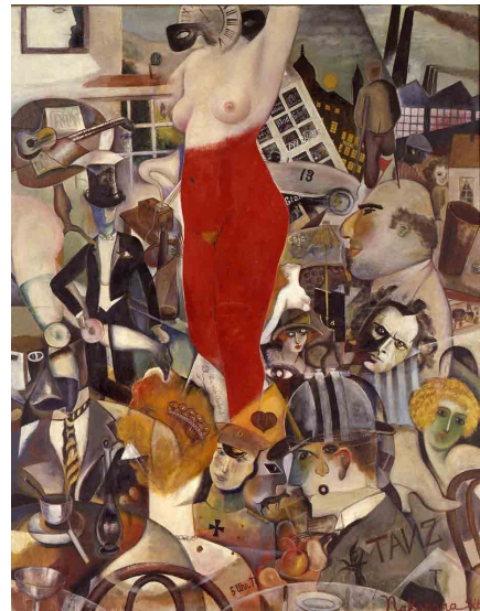
3. 中原實《ヴィナスの誕生》1924年