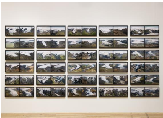
3 オラファー・エリアソン 《溶ける氷河のシリーズ 1999/2019》 2019年 Courtesy of the artist; neugerriemschneider, Berlin; Tanya Bonakdar Gallery, New York / Los Angeles © 2019 Olafur Eliasson

エリアソンは、アイスランドの自然を20年以上にわたり撮影し続けてきました。《溶ける氷河のシリーズ 1999/2019》(2019)は、過去20年間の氷河の大きな変化を目に見えるかたちで示します。