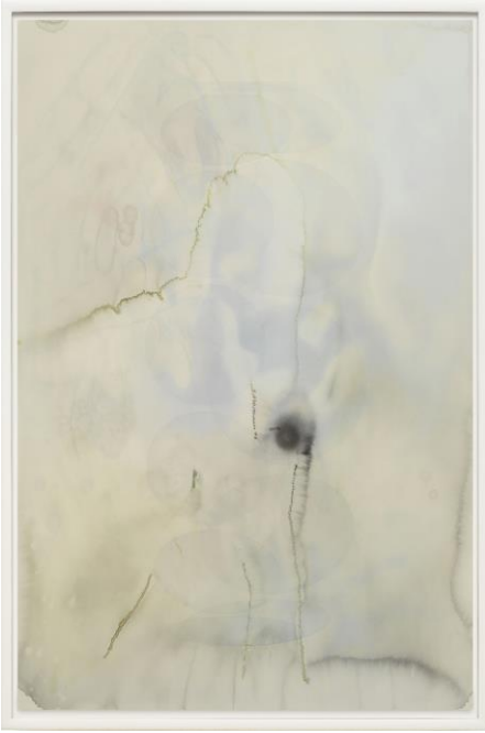
7 オラファー・エリアソン 《メタンの問題》 2019 年