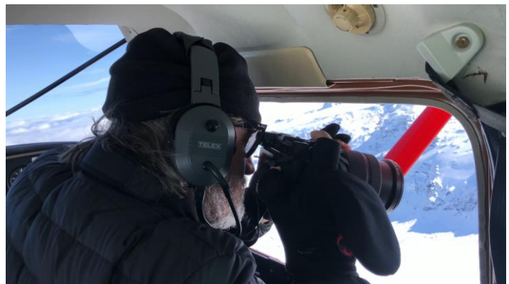
4 《溶ける氷河のシリーズ 1999/2019》(2019年)をレイキャヴィックで撮影するオラファー・エリアソン