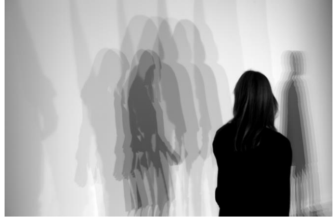
8 オラファー・エリアソン 《スローモーションの影》 2009 年 Installation view: 21st Century Museum of Contemporary Art, Kanazawa, Japan, 2009-2010