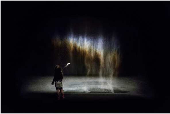
1 オラファー・エリアソン 《ビューティー》 1993年 Installation view: Moderna Museet, Stockholm 2015 Photo: Anders Sune Berg Courtesy of the artist; neugerriemschneider, Berlin; Tanya Bonakdar Gallery, New York / Los Angeles © 1993 Olafur Eliasson

展示室の内外で展開される2つの大規模なインスタレーション、写真のシリーズ、公共空間への介入をめぐる作品など、本展のための新作をご紹介します。また、鑑賞者の目の前に虹を再現する初期の代表作《ビューティー》(1993年)をはじめとする体験型作品やインスタレーションを展示します。