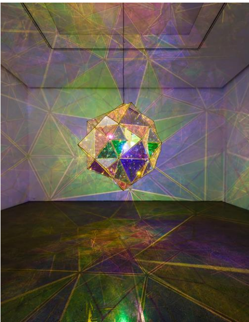
9 オラファー・エリアソン 《太陽の中心への探査》 2017 年 Installation view: PKM Gallery, Seoul, 2017 Photo: Jeon Byung Cheol, 2017 Courtesy of the artist and PKM Gallery, Seoul © 2017 Olafur Eliasson