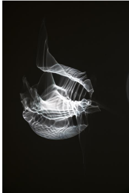
2 「オラファー・エリアソン ときに川は橋となる」展のための新作の試作、2019年