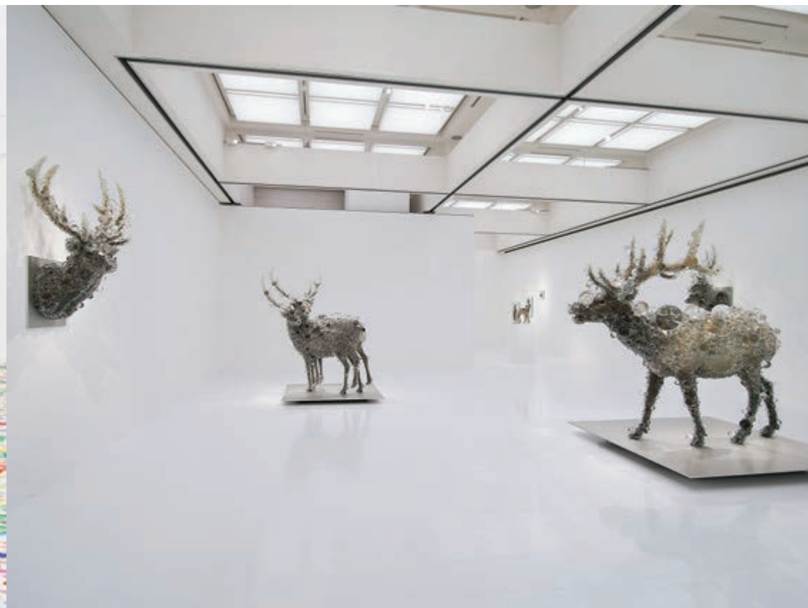
Installation view of "MOT collection", 2011-2012, Works of Kazuo Shiraga