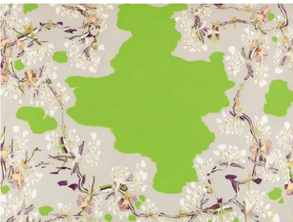
07 中西夏之 《G/Z 夏至・橋の上 IV》1993 ©NATSUYUKI NAKANISHI