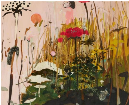
05 長井朋子 《白のリコーダーで花とか黄色とか黄土色を吹く》2007