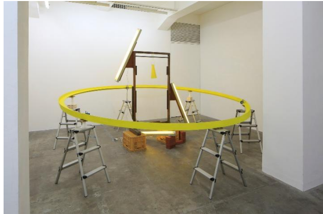
04 白川昌生 《Tomoko & Light》2014