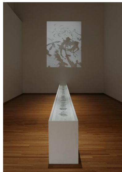
08 石田尚志 《海坂の絵巻》2007