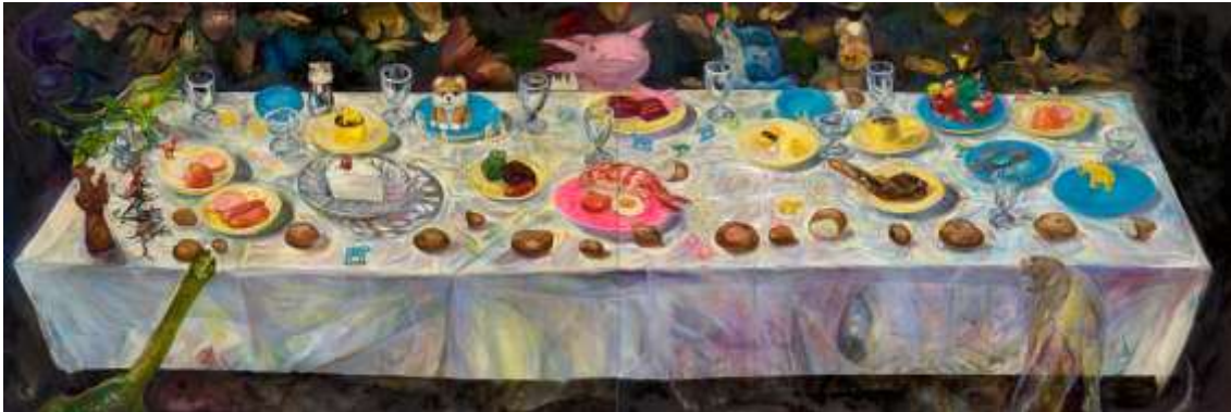
03 松井えり菜 《イミテーションサバー》2023