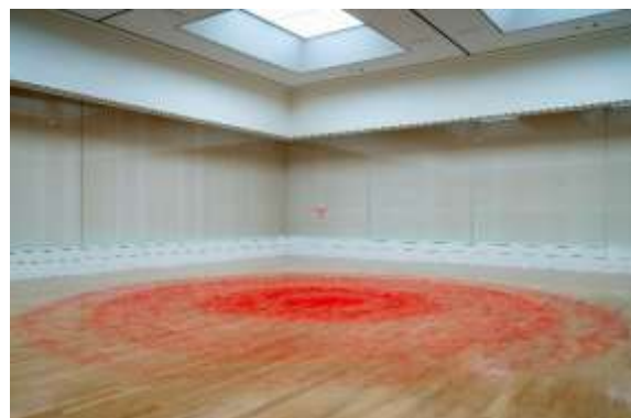
07 池内晶子 《Knotted Thread-red-Φ1.4cm-Φ720cm》2021 「池内晶子 あるいは、地のちからをあつめて」展（府中市美術館） 展示風景