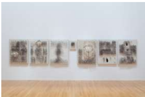
06 中西夏之 《洗濯バサミは攪拌行動を主張する》 1963（一部 c.1981 再制作） Photo: Keizo Kioku ©NATSUYUKI NAKANISHI