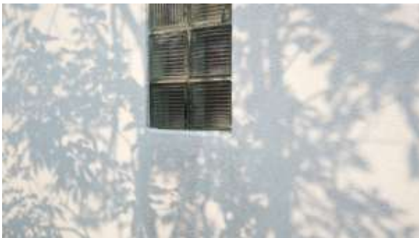
04 ミヤギフトシ 《A Romantic Composition》2015