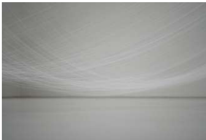
左) 08 中西夏之 《柔かに、還元 I》1996 ©NATSUYUKI NAKANISHI