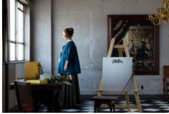
左) 01 ユアサエボシ 《軍装姿の自画像》2022 高松市美術館蔵（特別出品）