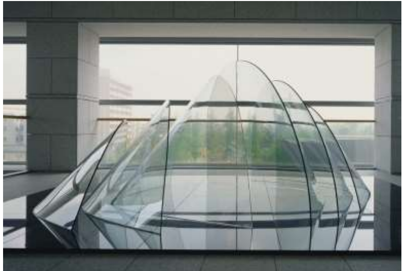
10 多田美波《相 (Phase)》1989