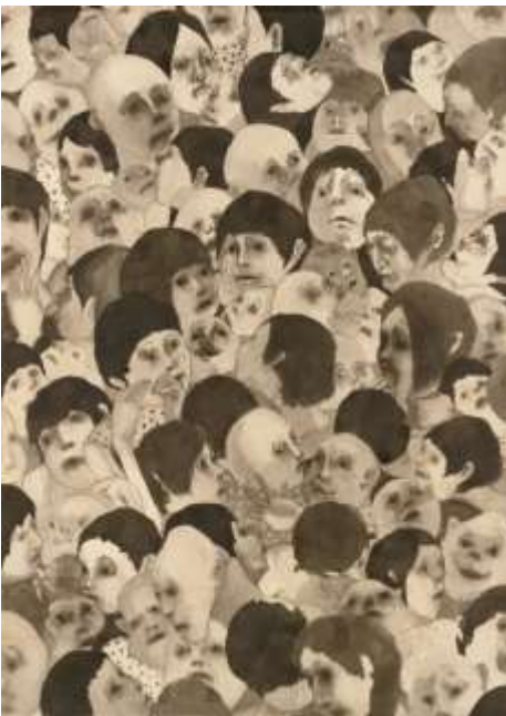
12 中園孔二《ポスト人間》2007