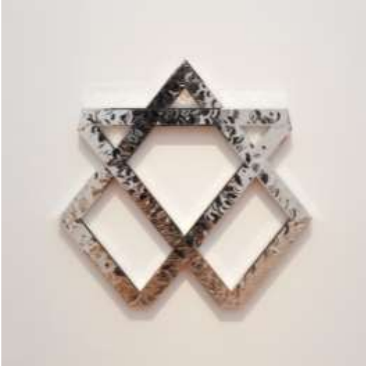
9 モニール・ファーマンファーマイアン《Heptagon》 2008