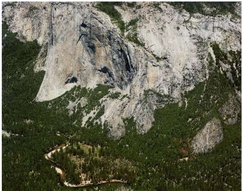
13 松江泰治《YOSEMITE 35140》2023