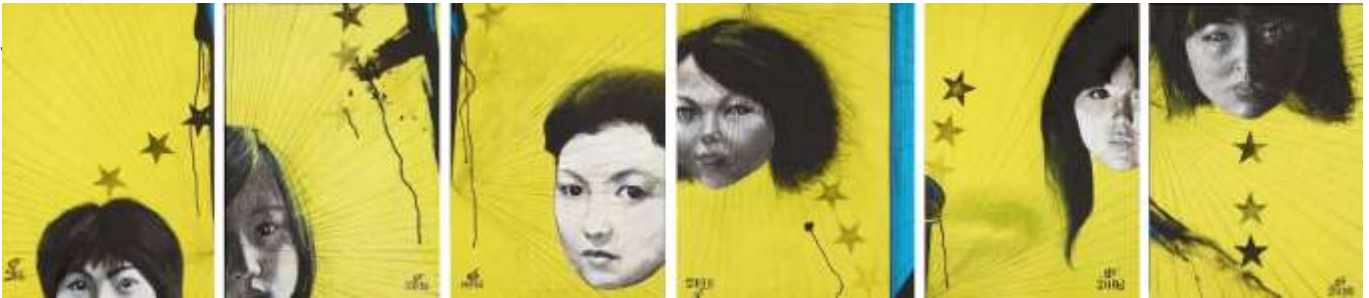
11 中村宏《明暗法からの視線》2015-16