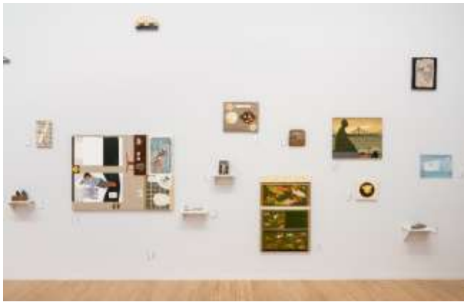
4 ワタリドリ計画 (麻生知子、武内明子) 《シリーズ 深川の旅》2020 / 「MOT コレクション 歩く、赴く、移動する 1923→2020」展示風景 (2023)