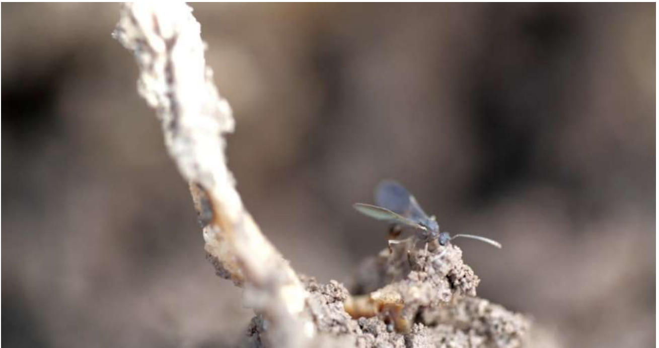
14 マヤ・ワタナベ 《境界状態》2019