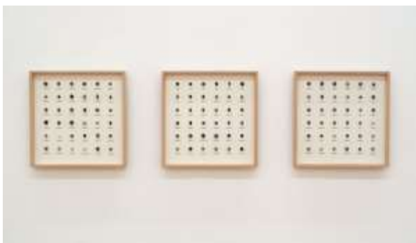
6 栗田宏一 《POYA DAY—満月の夜の小石拾い》1991-99