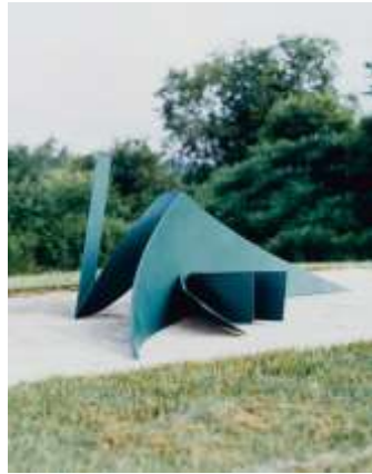
5 安齊重男 《アンソニー・カロ《シー・チェンジ》1970 [安齊重男写真集『CARO by ANZAï』(1992年発行)のためのカット]》1994,2014