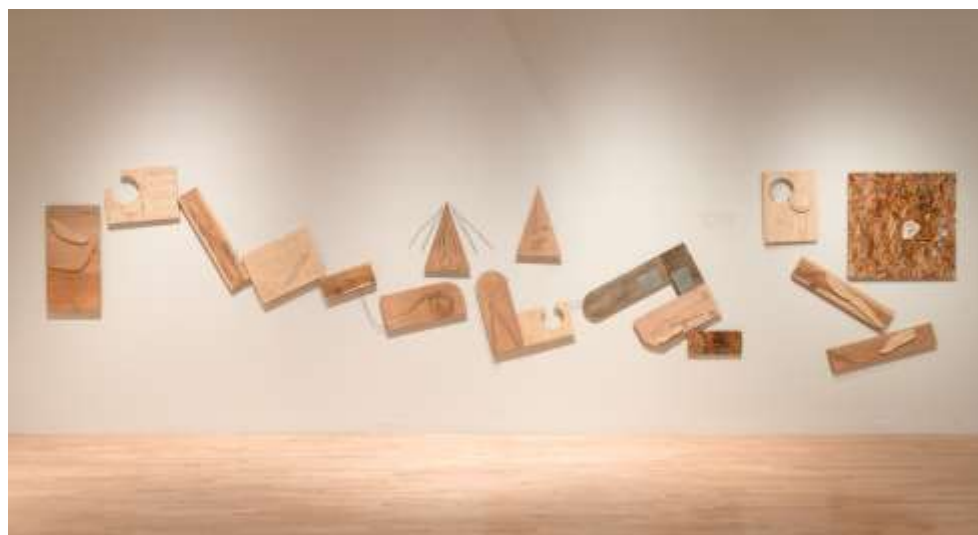
3 光島貴之《ハンゾウモン線・清澄白河から美術館へ》2019