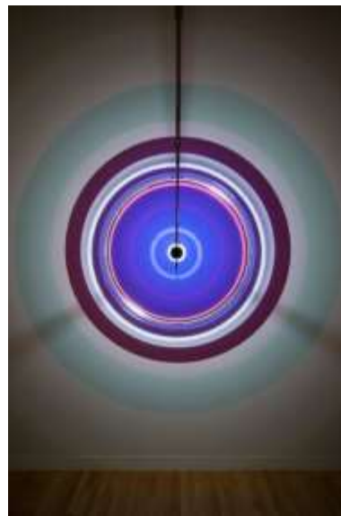
7 オラファー・エリアソン 《人間を超えたレゾネーター》2019 © Olafur Eliasson