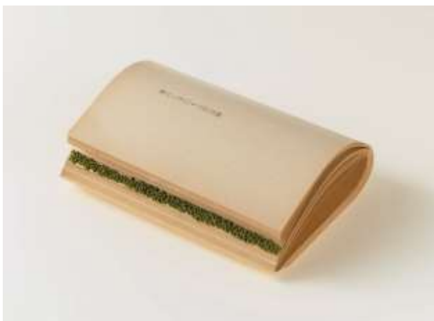
8 福田尚代 《『ナイン・ストーリーズ』 #02》2003

お問い合わせ 東京都現代美術館 事業企画課 企画係 広報班 内堀・工藤・稲葉 TEL : 03-5245-1134 (直通) / FAX : 03-5245-1141 E-MAIL : mot-pr@mot-art.jp WEB : https://www.mot-art-museum.jp