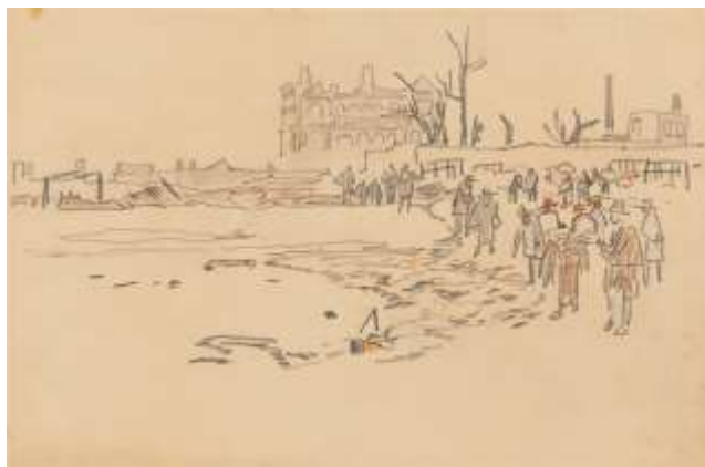
1 鹿子木孟郎《震災スケッチ（避難民と焼野）》1923