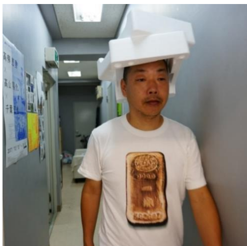
6 作家ポートレート

1966年、山梨県生まれ。1993年、多摩美術大学大学院美術研究科修士課程修了。アジアン・カルチュラル・カウンシルの助成を受けて、ニューヨークやベルリンに滞在し、制作・発表を行う。2001年第4回岡本太郎現代芸術賞 優秀賞。2004年ヴェネチア・ビエンナーレ第9回国際建築展参加。毎年3月9日をアートの日とする「サンキューアートの日」企画、震災支援活動「デイリリーアートサーカス」主宰。近年の主な個展に「中二病」(2016年、市原湖畔美術館)、「あれこれ開発工場」(2019年、箱根彫刻の森美術館)、「開発再考 Vol.1, 2, 3」(2019、2022年、ANOMALY)、主なグループ展に越後妻有大地の芸術祭(2006-)、市原アートミックス(2014-)、「あそびのじかん」(2019年、東京都現代美術館)。