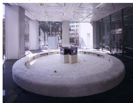
8 《都会生活者のオアシス》 ZOOM ゼクセルアートスペースでの展示風景 2000年