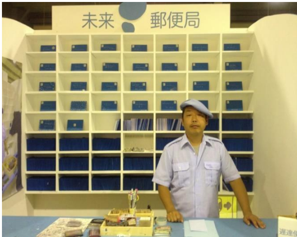
2 《未来郵便局》「ヨコハマトリエンナーレ 2011」 特別連携プログラム「新・港村～小さな未来都市」 (BankART Life III) での展示風景 2011 年