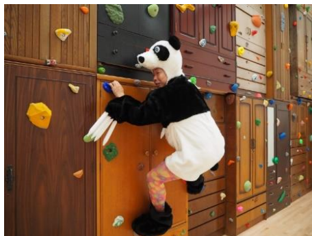
9 木場のダメパンダ

お問い合わせ：東京都現代美術館 事業企画課 企画係 広報班 工藤・稲葉・内堀 TEL：03-5245-1134 (直通) / FAX：03-5245-1141 E-MAIL：mot-pr@mot-art.jp URL：https://www.mot-art-museum.jp ※開催内容は、都合により変更になる場合がございます。予めご了承ください。