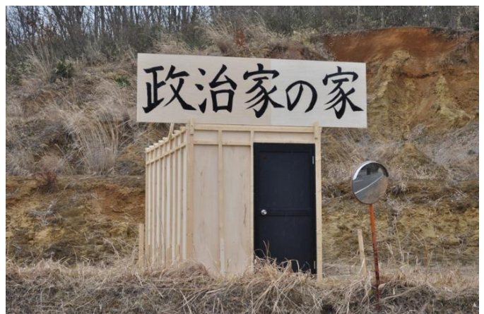
5 《政治家の家》福島県南相馬市 2012 年

お問い合わせ：東京都現代美術館 事業企画課 企画係 広報班 工藤・稲葉・内堀 TEL：03-5245-1134（直通）/ FAX：03-5245-1141 E-MAIL：mot-pr@mot-art.jp URL：https://www.mot-art-museum.jp ※開催内容は、都合により変更になる場合がございます。予めご了承ください。