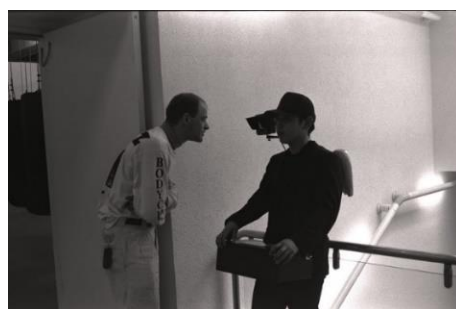
7 ドクメンタ9でのパフォーマンス 1992年

100人のユニークな講師陣による、ユニークな授業を会期中100回行う「100人先生」をはじめとして、東北でのプロジェクトや39アートの日の関係者を招いてのトークイベント、ライブパフォーマンス、ワークショップなどを展示室内や講堂で日々多数行い、動きと変化、出会いと対話が起こる場を創出します。