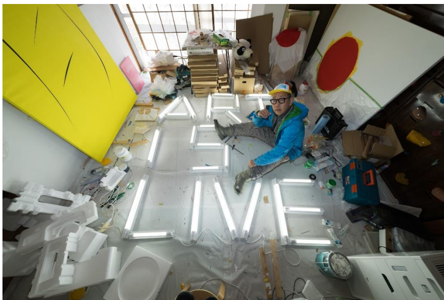
1 《ART IS LIVE》2024年