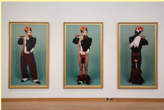
森村泰昌《肖像(少年1, 2, 3)》1988 MORIMURA Yasumasa, Portrait (Shonen1, 2, 3), 1988

To be published in late March 2019 by BIJUTSU SHUPPAN-SHA Co.,LTD. and sold in the museum shop.