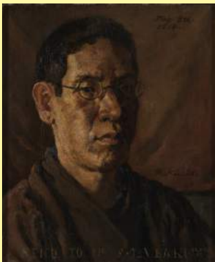
岸田劉生《椿君に贈る自画像》1914 KISHIDA Ryusei, Self-Portrait Sent to Mr.TSUBAKI , 1914