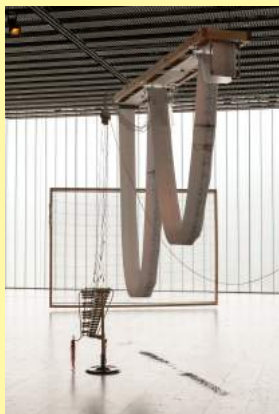
毛利悠子《I/O》(せんだいメディアテークでの展示風景)2011-16 MOHRI Yuko, I/O, (Installation view at Sendai Mediatheque), 2011-16