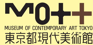
リニューアル・オープン記念ロゴ