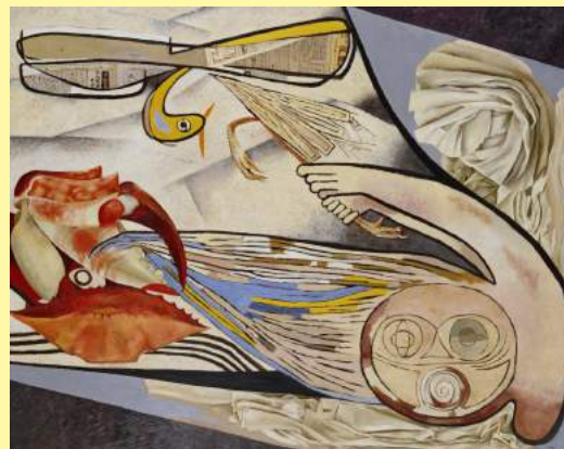
桂ゆき《抵抗》1952 KATSURA Yuki, Resistance , 1952