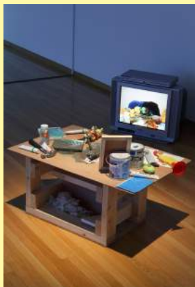
泉太郎《ステーキハウス》2009 IZUMI Taro, Steak House, 2009