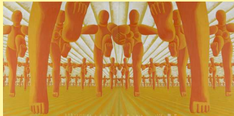
雙嘯《田園》1956 Ay-O, Pastoral , 1956