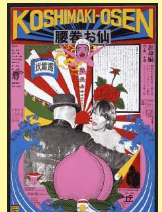
横尾忠則《腰巻お仙》(劇団状況劇場)1966 YOKOO Tadanori, KOSHIMAKI-OSEN , Gekidan Jokyō Gekijō, 1966