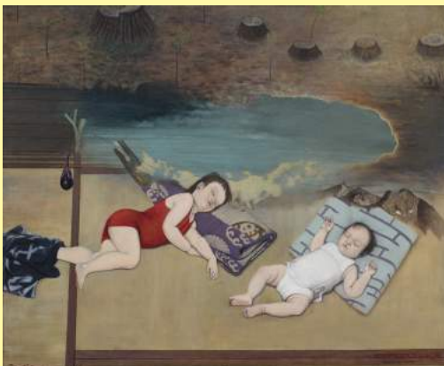
中原實《杉の子》1947 NAKAHARA Minoru, Baby Cedar , 1947