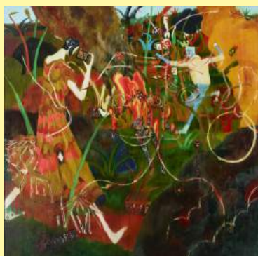
中園孔二《無題》2012 NAKAZONO Koji, Untitled , 2012