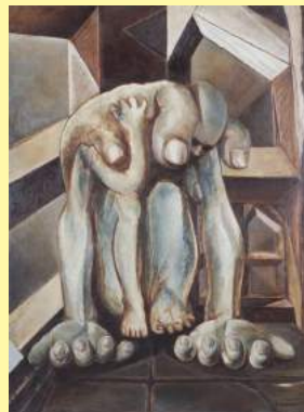
鶴岡政男《重い手》1949 TSURUOKA Masao, Heavy Hand , 1949