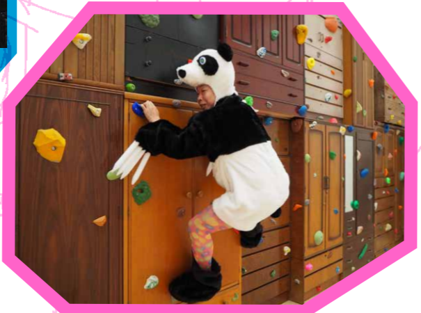
木場のダメパンダ