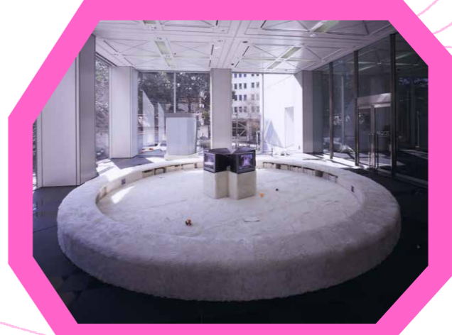
「都会生活者のオアシス」ZOOM セクセルアートスペースでの展示風景 2000年