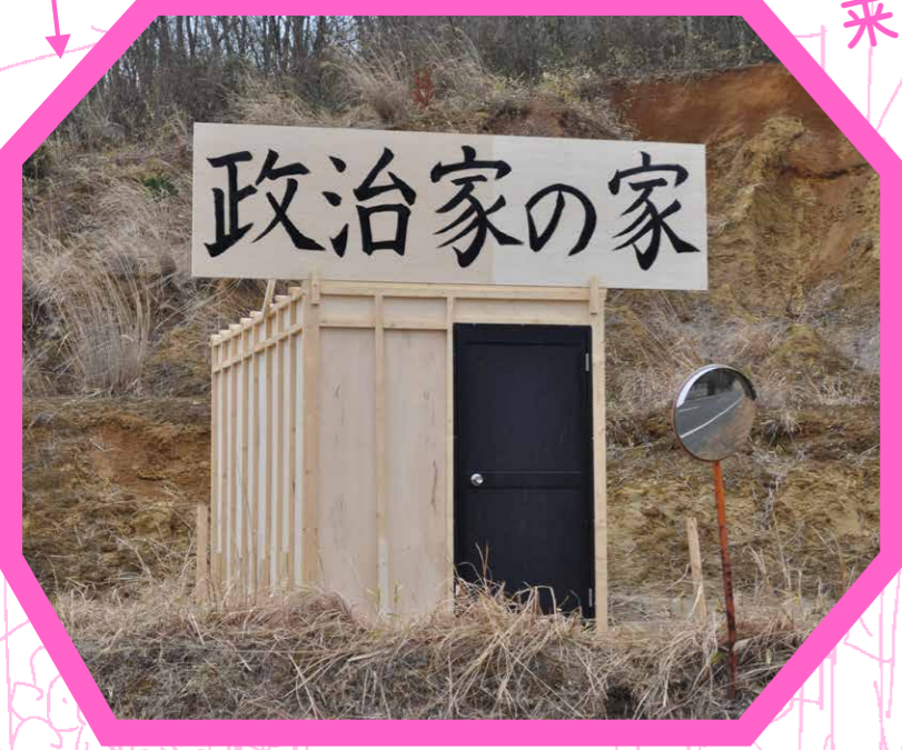
「政治家の家」福島県南相馬市 2012年