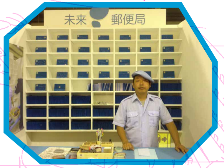
「未来郵便局」『ヨコハマトリエンナーレ2011』特別連携プログラム 「新・港村～小さな未来都市」(BankART Life III)での展示風景 2011年