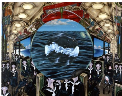
⑤ 中村宏《円環列車A(望遠鏡列車)》1968年 油彩／カンヴァス 東京都現代美術館蔵