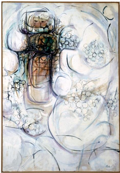
① 福島秀子《作品》1958年 油彩／カンヴァス 東京都現代美術館蔵