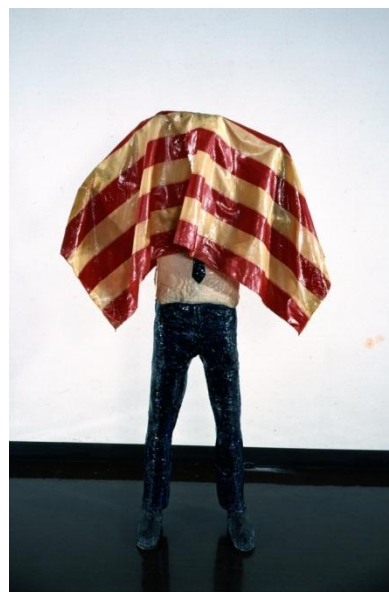
④ 小島信明《無題》1964年頃-1966年 ラッカー、ポリエステル樹脂 東京都現代美術館蔵