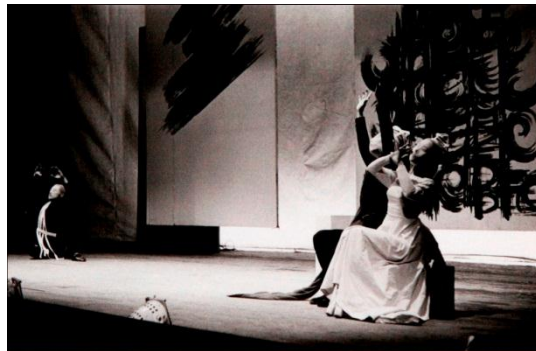
② バレエ実験劇場『乞食王子』の舞台 美術：福島秀子 撮影：大辻清司 1955年 東京都現代美術館蔵